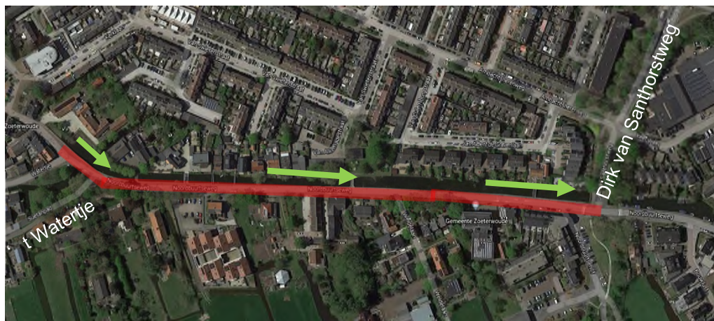
— Werkvak Noordbuurtseweg gestremd → Werkrichting

Deze planning is onder voorbehoud van (weers-)omstandigheden.