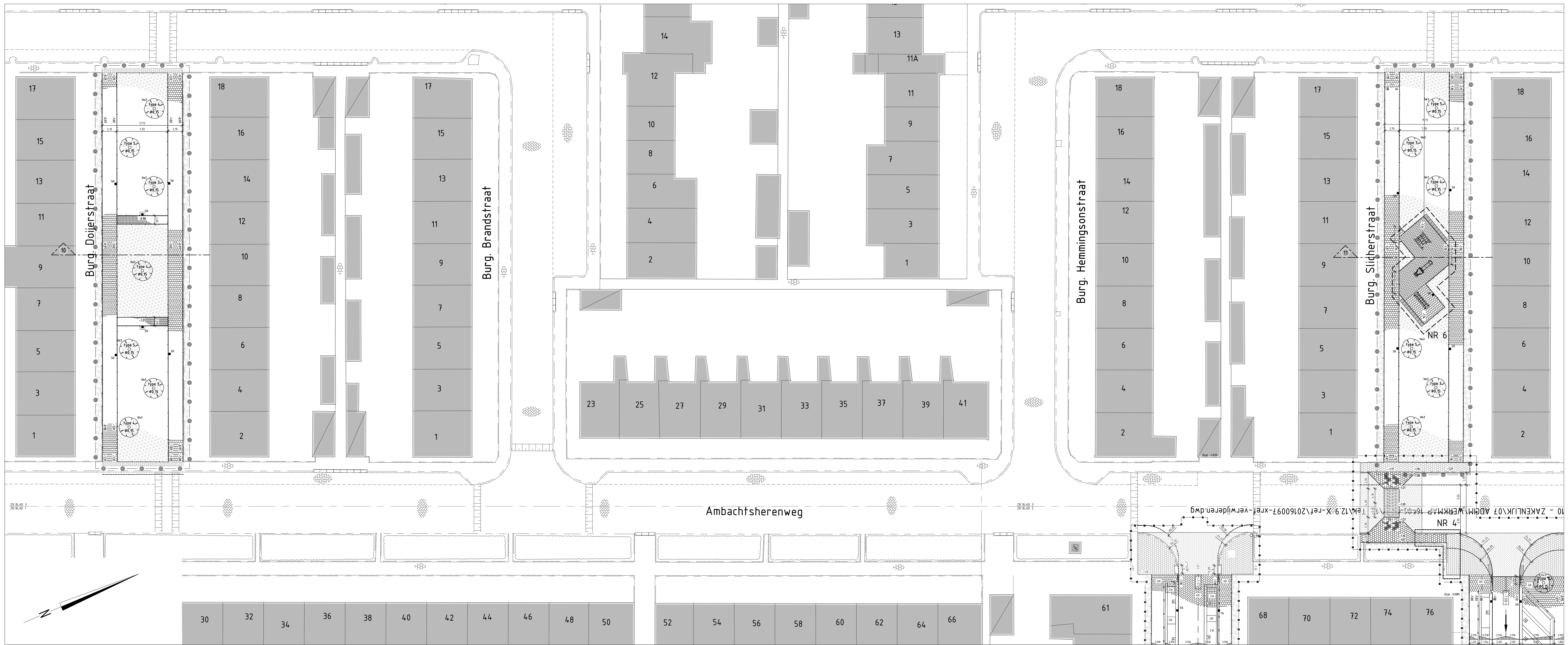
Herinrichting - Burgemeester Doyerstraat / Slicherstraat. Schaal 1:200